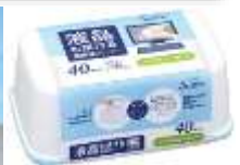
各メーカーの除菌クリーナー